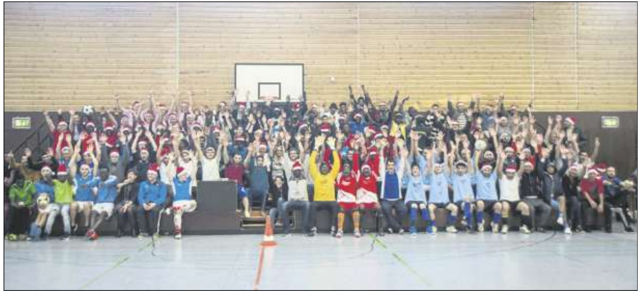
Bevor das erste Spiel startete, sammelten sich alle für ein großes Gruppenfoto. Dabei wurden die Teilnehmenden mit dem Grundwerkzeug eines jeden Nikolausturniers, einer Nikolausmütze, ausgestattet.

Mehr über den Freundeskreis Flüchtlinge Leutenbach & Winnenden erfährt man unter www.freundeskreis-leutenbach-winnenden.de . Über diese Homepage, wie auch über die E-Mail-Adresse info@freundeskreis-leutenbach-winnenden.de ist der Freundeskreis für alle erreichbar, die sich in der Arbeit mit ge-