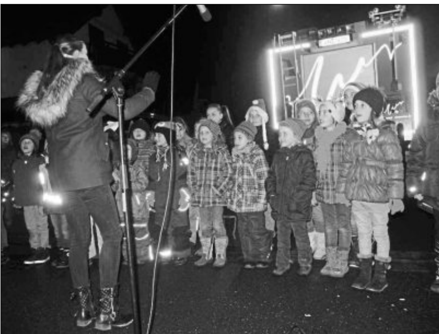
Der Schulchor der Grundschule Höfen bei der diesjährigen Eröffnung der Baacher Christbaumschmücketse.